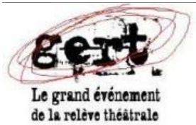
GERT 2009 - 3 nov. - Lion d'Or