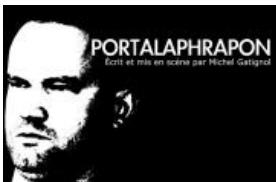
PORTALAPHRAPON - Artemage - Espace Geordie - 20 au 31 octobre