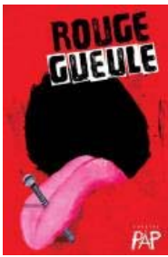
Rouge Gueule - Théâtre Pap - Espace Go, du 20 octobre au 14 novembre