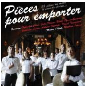
Les Néos - Pièces pour emporter - Théâtre Mainline, 25 oct.