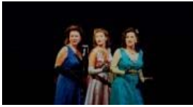
Till We Meet Again - Theater Panache - Salle Oscar Peterson 16, 17, 18 oct. et 21, 22 nov.